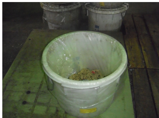
生ごみの運搬・保管については、写真の樽を使用し、2重のビニール袋に入れて密閉力の有る樽を閉めることで悪臭が出るのを防ぎます。

また生ごみ(食品廃棄物)を処理する施設に於きましては、運搬の持ち込みの際、生ごみの保管の際について、悪臭を極力、発生させないために密閉力の高いプラスチック製の樽を使用します。この樽を使用することで中にある生ごみの臭いを封じ込め、悪臭の飛散を防止します。