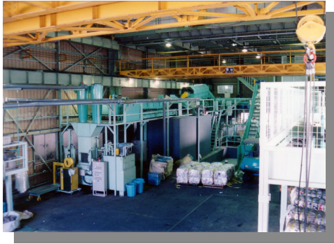
自社プラスチックリサイクル工場