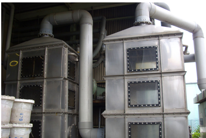
自社工場にある洗浄脱臭機 この機械によって、処理機から発生する悪臭を水洗浄によって除去します。

生ごみ(食品廃棄物)を扱っている為、小まめな清掃を心掛け、高圧洗浄機を使用し、洗浄を行う事で悪臭を防止します。洗浄後は、消臭剤を散布し、悪臭を除去致します。