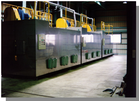
自社生ごみ堆肥化工場