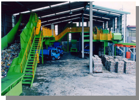
自社ビン・缶リサイクル工場