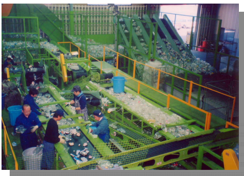
自社ペットボトルリサイクル工場